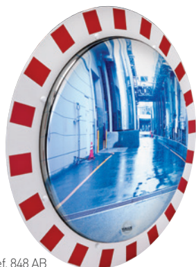
Ref. 848 AB