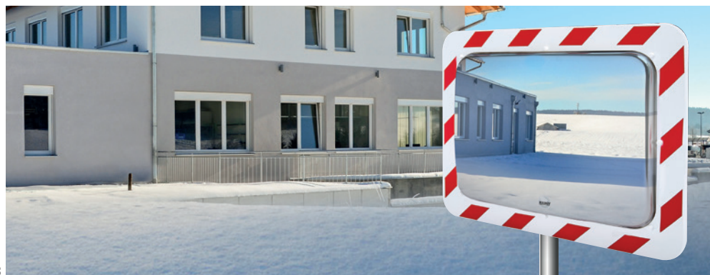
Ref. 858 AB